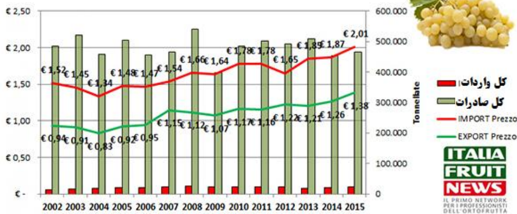
واردات و صادرات انگور خوراکی ایتالیا از/به جهان

صادرات انگور در سال 2014 معادل 450 هزار تن و به ارزش 550 میلیون یورو گزارش شده است. عمده تولیدات ایتالیا به کشورهای اروپائی بخصوص آلمان صادر می شود